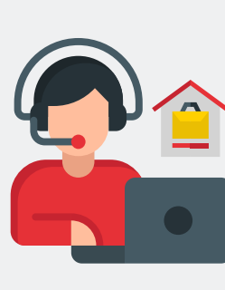
Impulso del teletrabajo