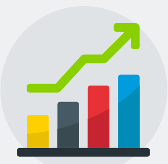
Crecimiento de los datos digitales

En este escenario, la seguridad está siendo una palanca esencial debido a varios factores: