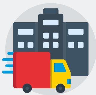
Distribución y servicios

Debido a su transversalidad, el mercado de la ciberseguridad crecerá en todos los sectores de la economía, especialmente en el de distribución, servicios y el público.