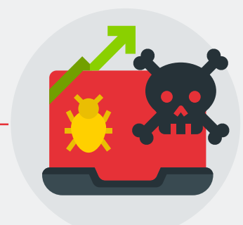
Incremento de las ciberamenazas

Estos factores impulsan el mercado de la ciberseguridad en España.